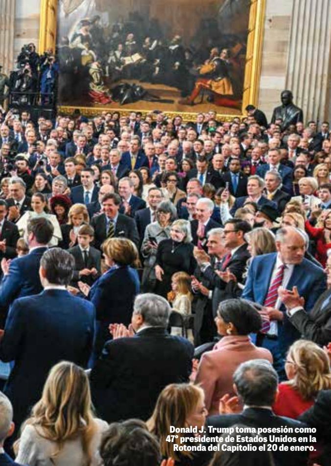
Donald J. Trump toma posesión como 47° presidente de Estados Unidos en la Rotonda del Capitolio el 20 de enero.

reconocer Su poder, pensar profundamente en ello y crecer en temor y respeto hacia Él!