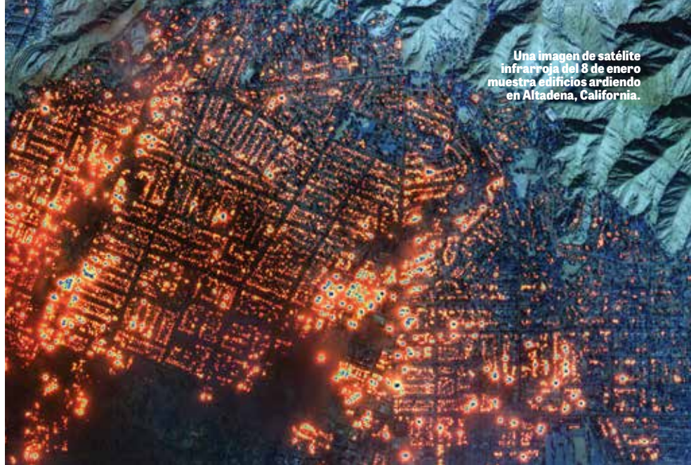
Una imagen de satélite infrarroja del 8 de enero muestra edificios ardiendo en Altadena, California.

LA PROFECÍA DE MALAQUÍAS ES UNA FUERTE ADVERTENCIA DIRIGIDA A LOS PROPIOS MINISTROS DE DIOS QUE SE REBELARON CONTRA ÉL. En estos versículos que concluyen el libro, Dios dice, Ustedes deben unir a las familias, a las familias físicas y a la Familia de Dios, como lo hizo el Sr. Armstrong. Si fracasan, ¡perderán su salvación a menos que despierten! La “maldición” de Malaquías 4:6 ¡es la pérdida de la vida eterna! ¡Esta es la advertencia más fuerte que pueda imaginar!